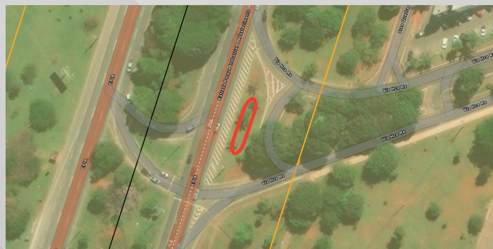
CANTEIRO CENTRAL DA AVENIDA DAS MANGUEIRAS, LOCALIZADA ENTRE O CRUZEIRO VELHO E O CRUZEIRO NOVO

Com os resultados, a Secretaria das Cidades e o Departamento de Estrada e Rodagem do Distrito Federal (DER/DF) analisaram o pedido e agora é buscar a efetividade da instalação da placa.